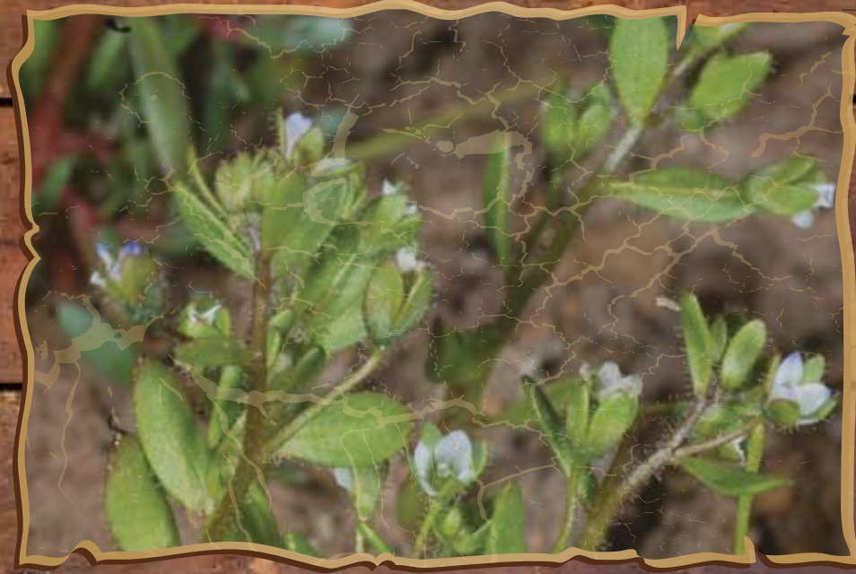
Βερόνικα της Οίτης ( Veronica oetaea *)