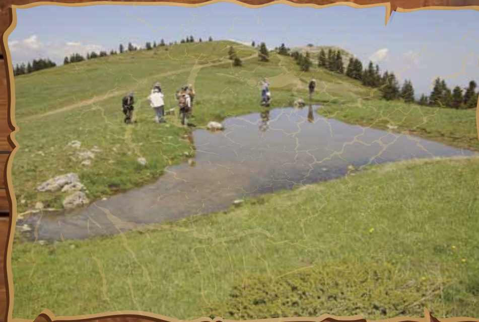
Εποχικό λιμνίο στο Γρεβενό της Οίτης