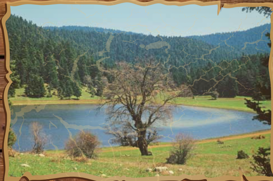
Εποχικό λιμνίο Νευρόπολης στο Καλλίδρομο