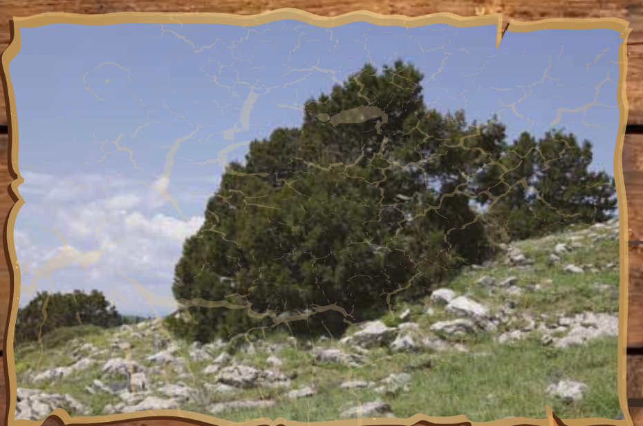
Μαλόκεδρο ( Juniperus foetidissima )